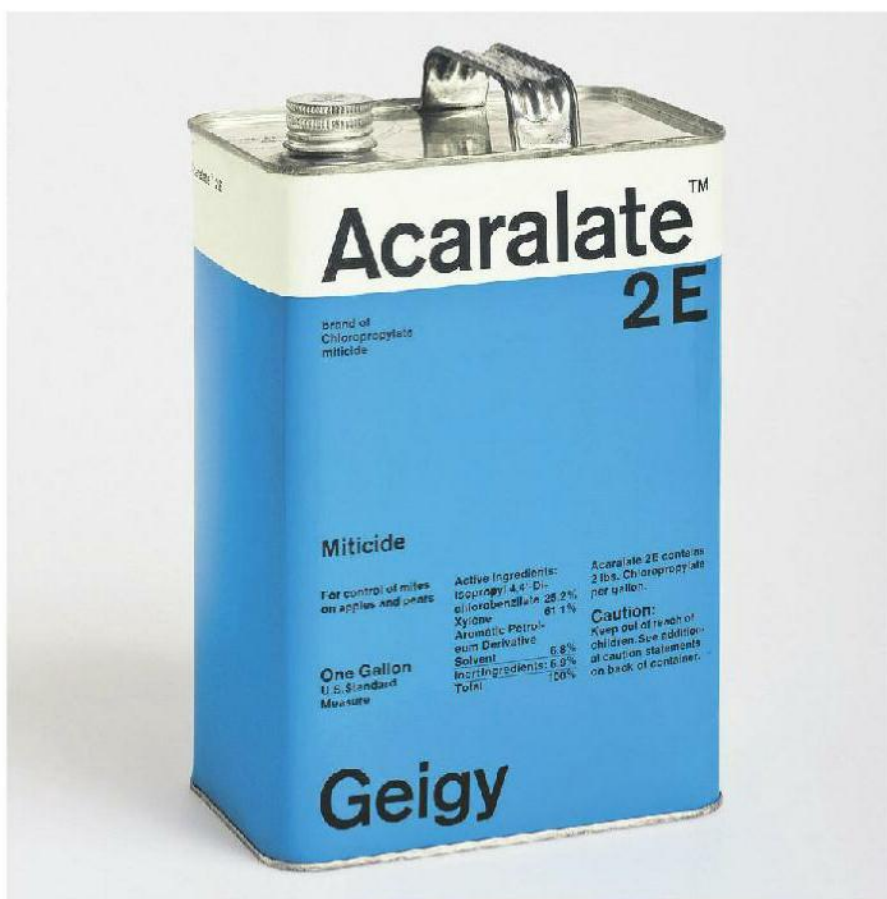
Unverwechselbar eigenständig: Kanister von Markus Löw.

Das Museum für Gestaltung zeigt Grafik und Werbung für Geigy von 1940 bis 1970