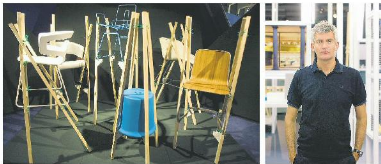
Die Entwicklung der Dinge: Installation «Vorwiegend Viehheime» in der Ausstellung von Design: Alfredo Häberli.

Bis 21. September. Podium am 9. Juli und 10. September. Publikation: Birkhäuser.