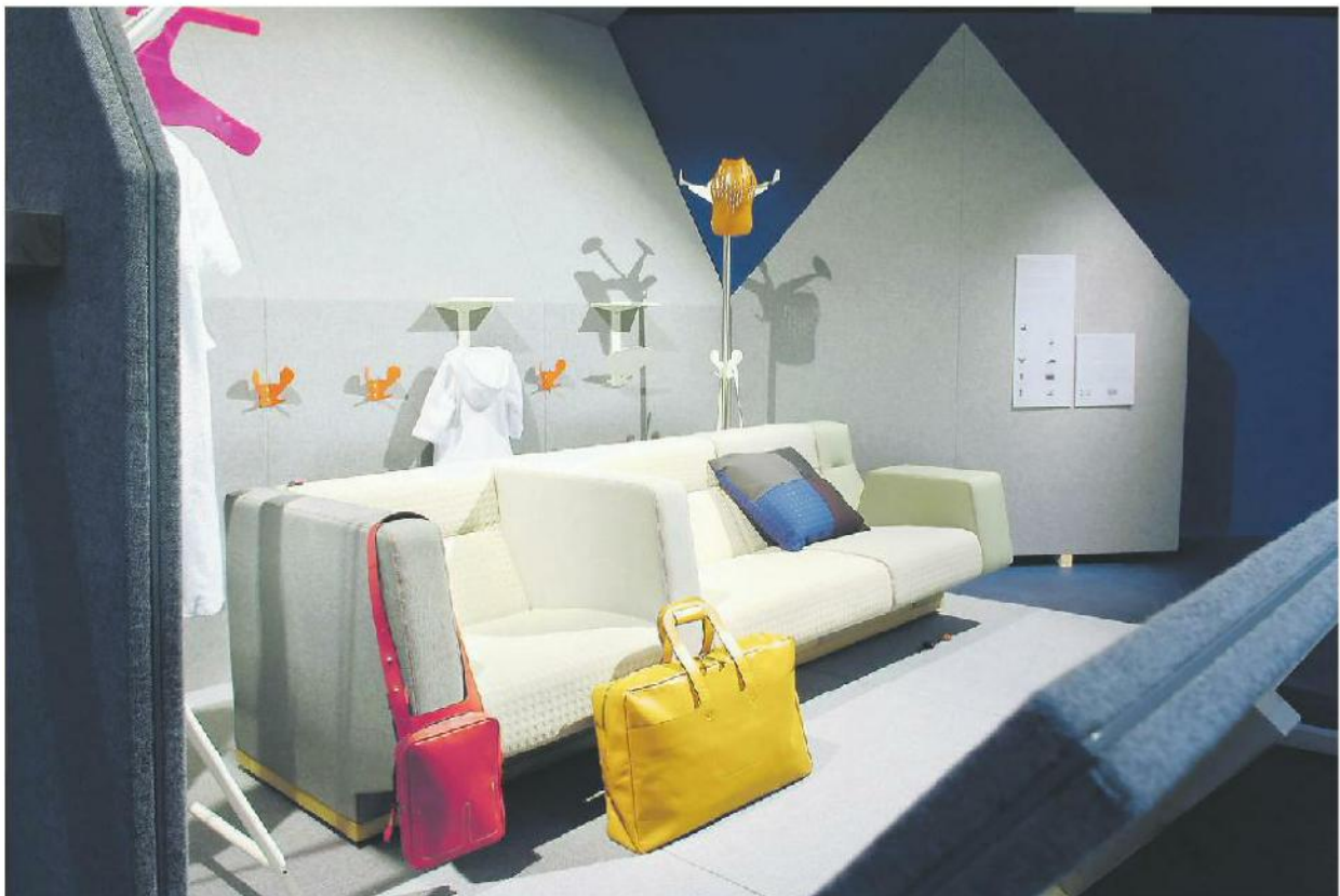
Einer von 13 «Spots» – künstlerische Inszenierungen von Alfredo Häberlis Arbeiten im Museum für Gestaltung. ELLEN MATHYS